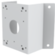
A35 CORNER MOUNT