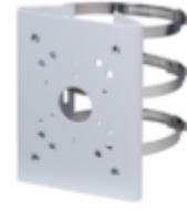
A36 POLE MOUNT