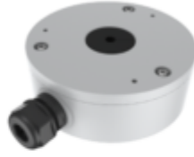
TC-P54BM SPEC: V5 JUNCTION BOX